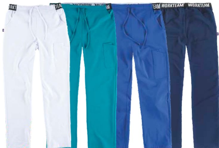
blanco turquesa azulina marino