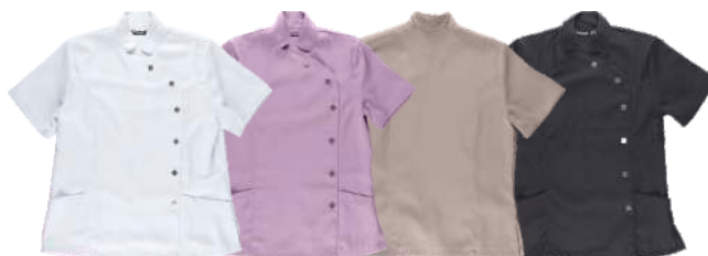
blanco malva beige negro