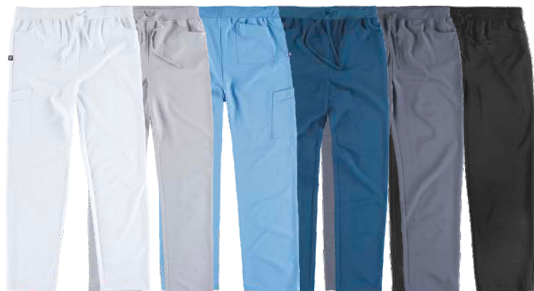
blanco gris claro celeste azafata gris negro