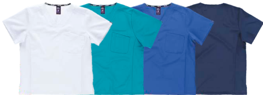
blanco turquesa azulina marino