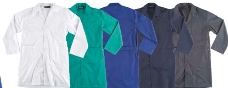
blanco verde azulina marino gris