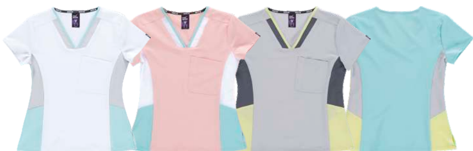
blanco/gris claro/ turquesa claro