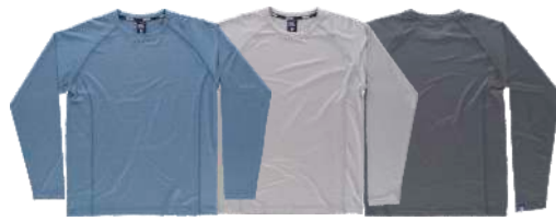
azafata gris claro negro