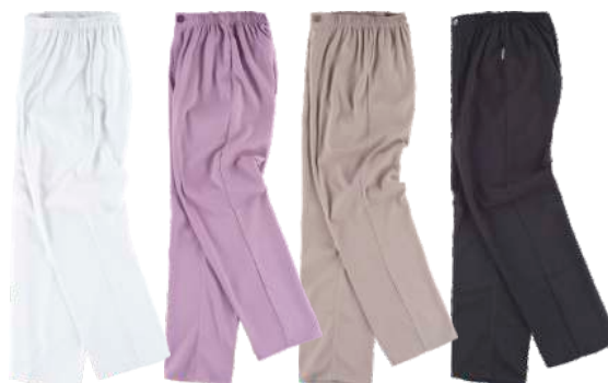
blanco malva beige negro