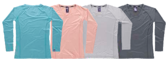
turquesa melocotón gris claro negro

Tejido: 93% Poliéster 7% Elastano (155 g/m2)