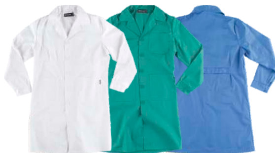
blanco verde celeste