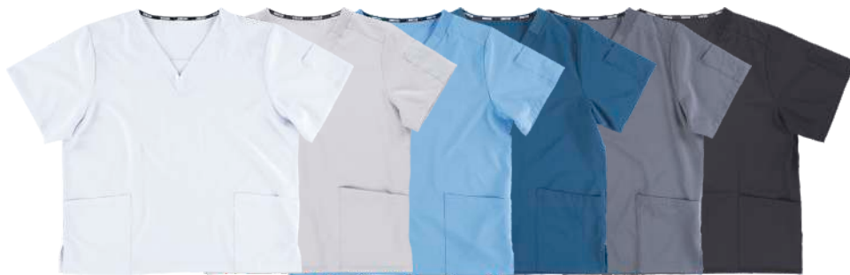
blanco gris claro celeste azafata gris negro